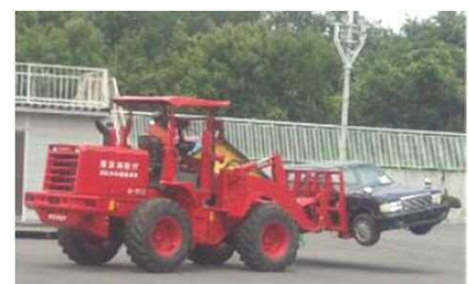
車両移動のための具体的方策 (例:ホイールローダーによる移動)