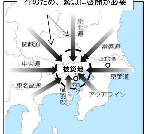
(首都直下地震における八方向作戦の例)