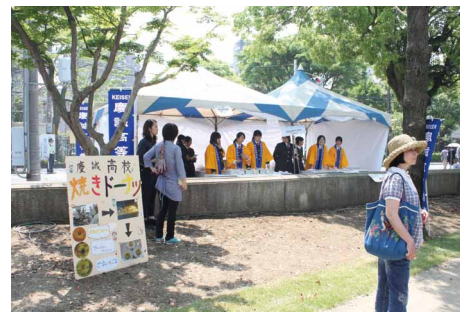
慶誠高等学校食物科