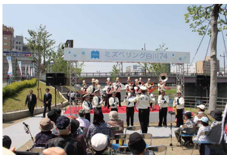
せせらぎコンサート(熊本工業高校)