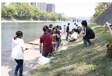
ペットボトルロケット