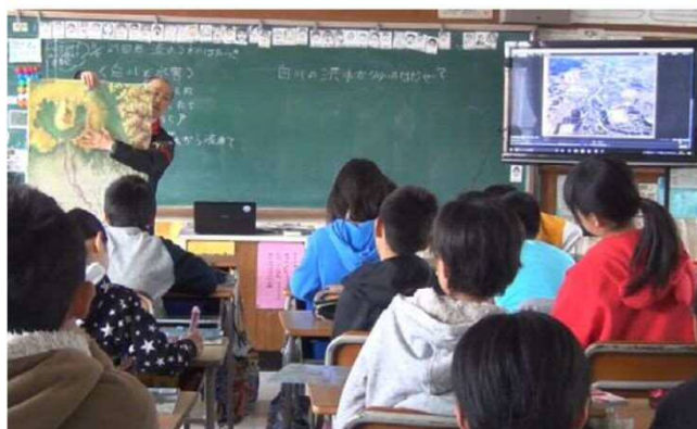
黒髪小学校試行授業実施状況