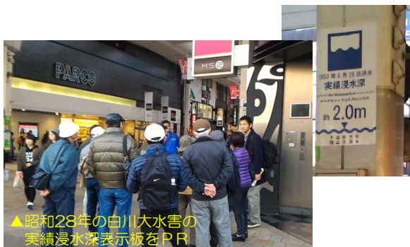
▲昭和28年の白川大水害の実績浸水深表示板をPR

参加者約80名が4班に分かれバスツアーを実施。白川・緑川堤防熊本地震復旧箇所、熊本県激甚災害対策特別事業箇所等の現場見学のほか、 熊本市街部約1.5kmを実際に歩きながら、浸水深表示板 やマンホールトイレ、 緑の区間の河川改修方法等についても現場説明 を行いました。