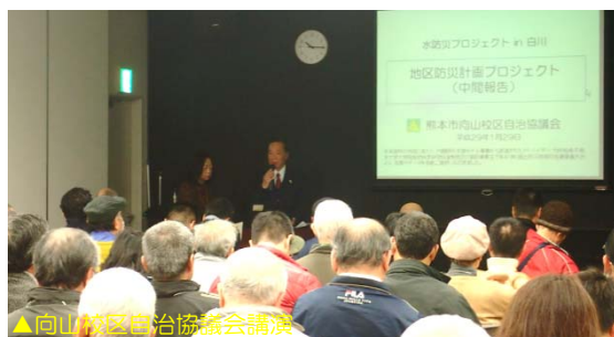
▲向山校区自治協議会講演

熊本市、向山校区自治協議会、NPO法人広域防災水難救助捜索支援機構がそれぞれの視点で講演。自助・共助について学びました。