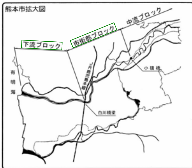
河川整備計画対象区間及びブロック分割図