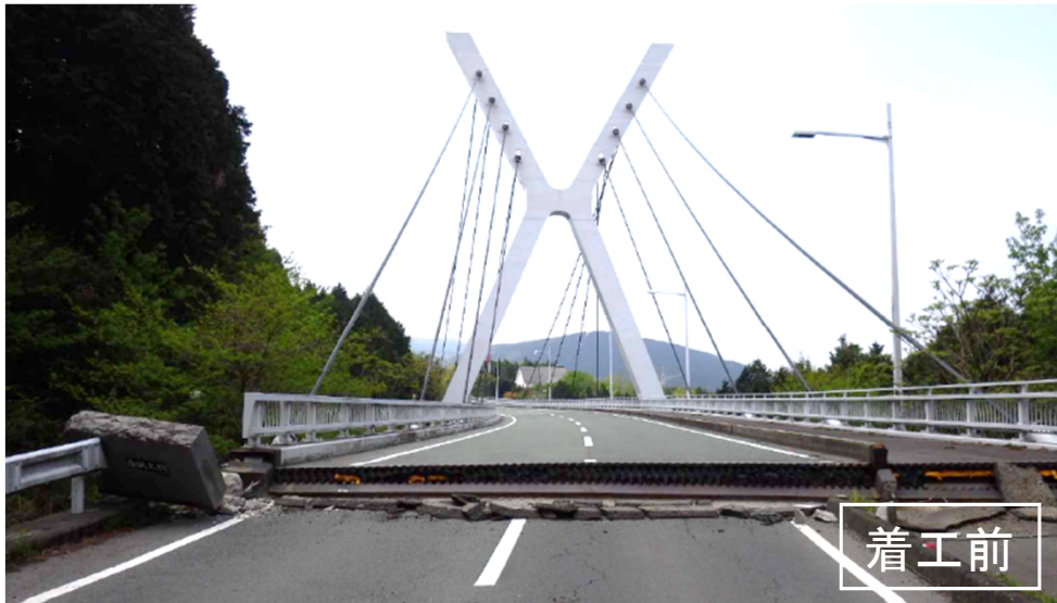
全景写真(熊本方面を望む)