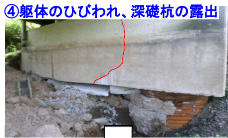
④躯体のひびわれ、深礎杭の露出