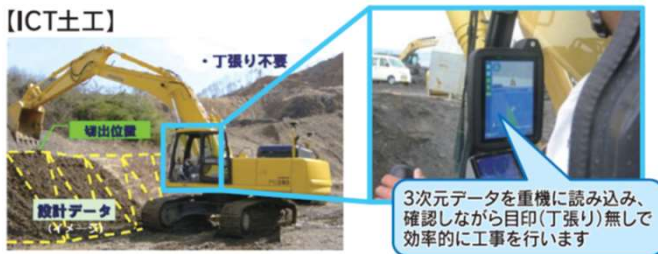
【ICT土工活用工事の効果】

取り組みの実施にあたっては、「 産学官 」の連携も視野に入れた 具体的な研修内容の検討に着手 していきたいと考えております。