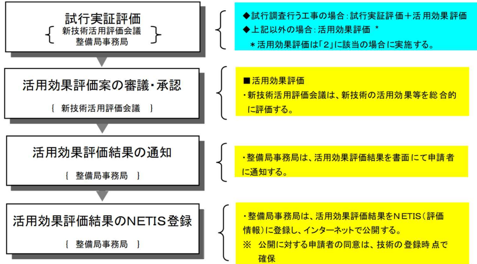
図6-2 活用効果評価の内容と流れ