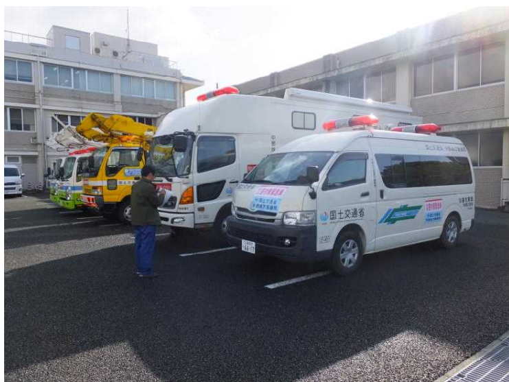
▲中部地方整備局 （待機支援車 2 台台）