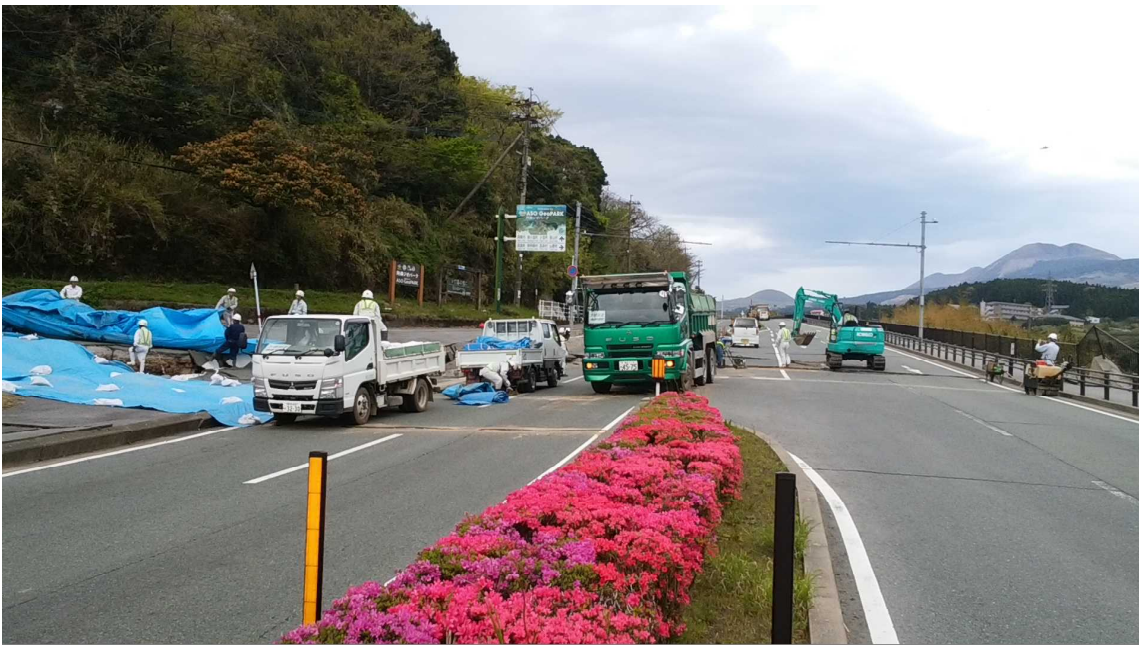
▲南阿蘇村立野国道 57 号被災状況