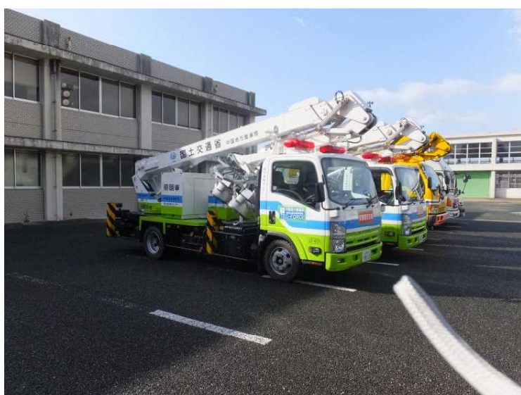
▲中国地方整備局 （照明車 3 台）