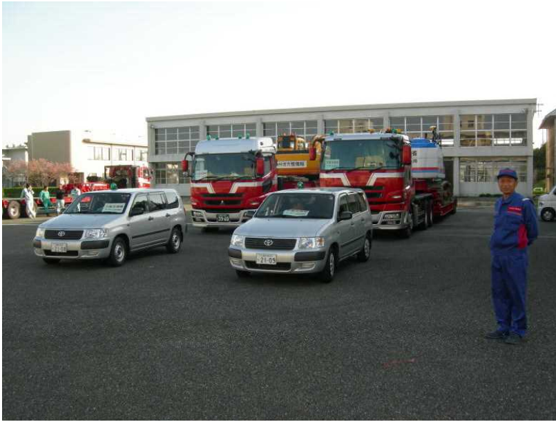
▲ 無人化施工機械 (分解式遠隔操縦 BH) (遠隔操縦 BH)