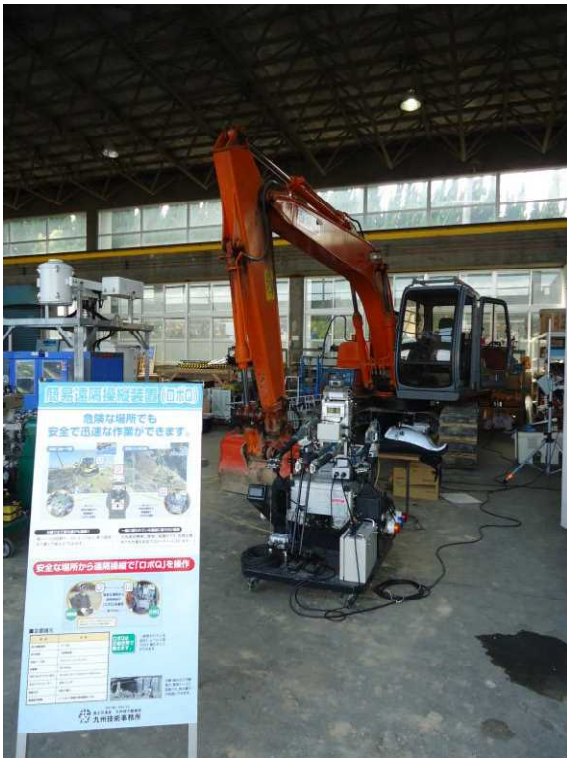
▲ 無人化施工機械 (簡易操縦式 BH (ロボ Q))