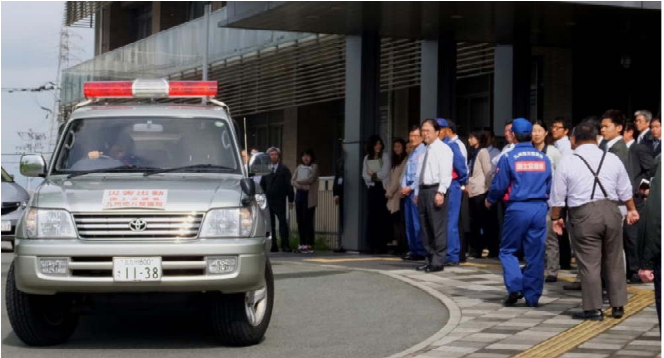
被災地へ出発する TEC-FORCE (テック・フォース) 隊員。 国土交通省筑後川河川事務所 (福岡県久留米市) にて