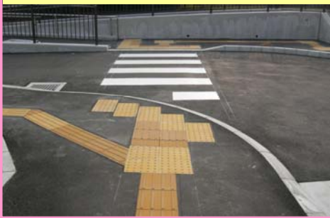
⑦ 点状ブロック設置比較