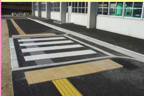
④ スムース歩道・エスコートゾーン