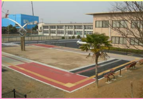
① 舗装+視線誘導ブロック輝度比