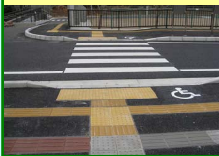
② 横断歩道縁石段差