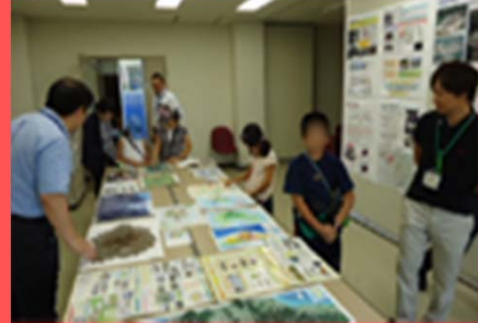
火山マップの展示