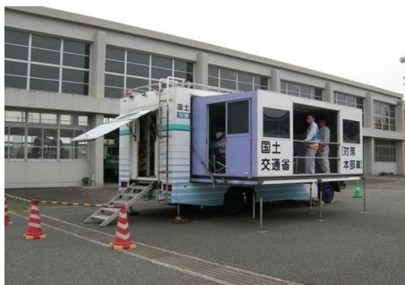
【災害対策用機械展示】 対策本部車設置