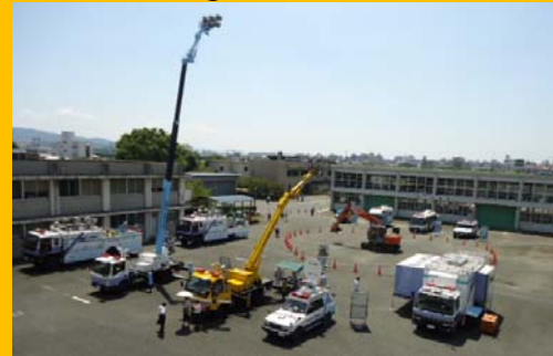
災害対策機械の展示