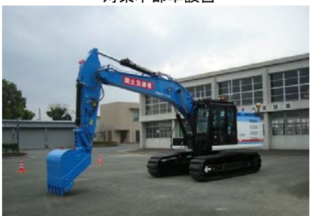
【災害対策用機械展示】 分解組立型バックホウ