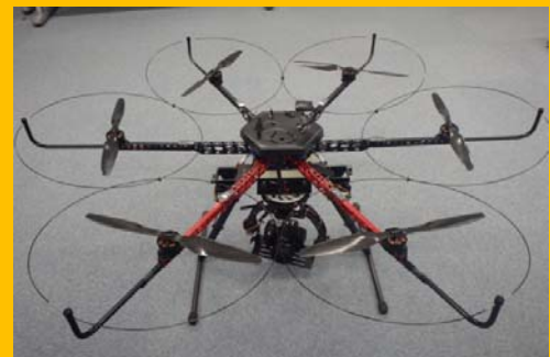
無人災害調査ヘリ操作実演