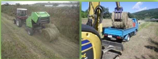
(H28年度 高鍋出張所管内) 用途別の配布実績