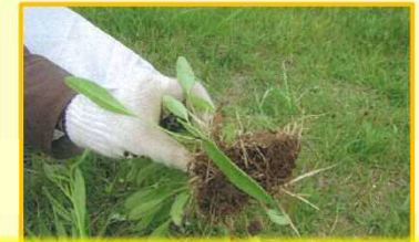
小丸川沿川において、開花前の4月末～5月上旬にかけてオオキンケイギクの駆除を行いました。