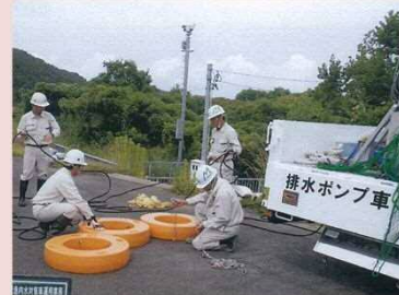
【排水ポンプ設置状況】

まもなく、梅雨や台風の時期がやってきます。高鍋出張所管内の災害時協力会社は、小丸川が増水した際などに堤防等に変状がないかの確認や浸水被害の軽減のための排水作業を実施して頂きます。風雨の中、昼夜を問わず地域の安心・安全に貢献して頂く上記4社と連携し、迅速な対応に努めて参ります。