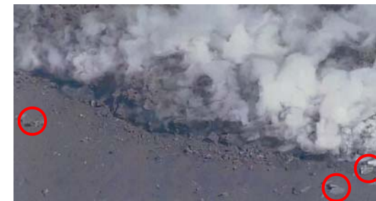
火口縁を越えた溶岩の先端部分 上:3月9日15時頃 下:3月9日16時頃

周囲の岩の位置との比較で、15時から16時にかけての1時間で溶岩の先端はほとんど移動していないことが分かった