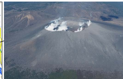
火口周辺斜面の降灰状況(3月10日)