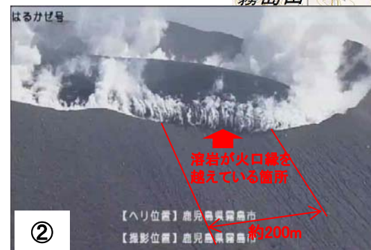
北西側から撮影(3月9日15時頃)

周囲の岩の位置との比較で、15時から16時にかけての1時間で溶岩の先端はほとんど移動していないことが分かった