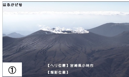
東側から撮影(3月9日15時頃)