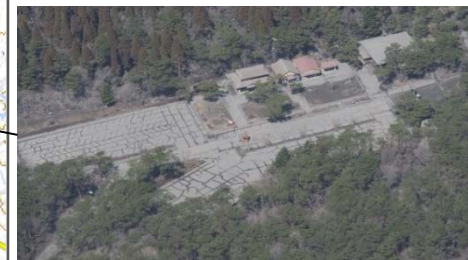
高千穂河原ビジターセンター付近の降灰状況(3月10日)