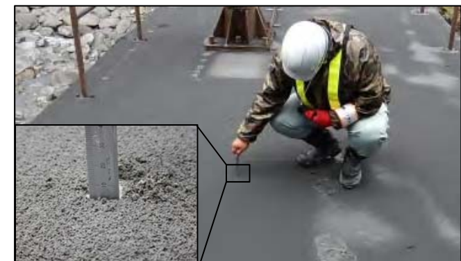
降灰調査の様子(平成30年3月3日)