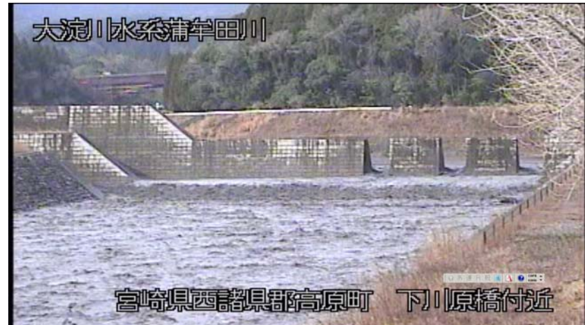
② 下川原橋付近 平成30年3月5日 9:45現在