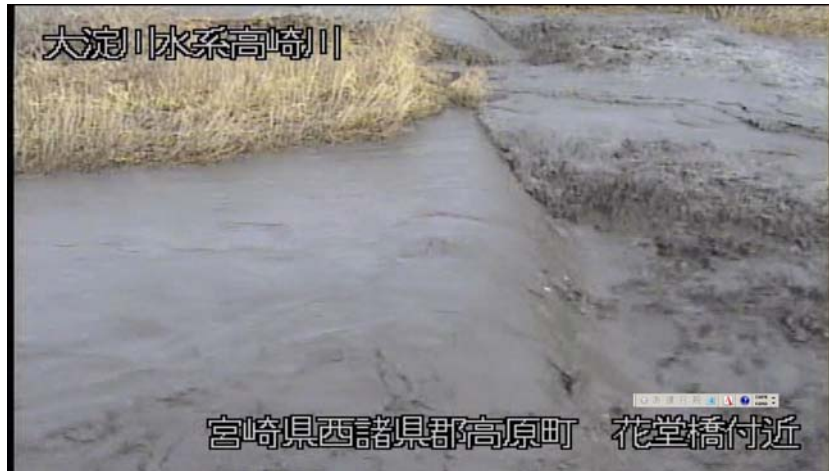
① 花堂橋付近 平成30年3月5日 9:45現在