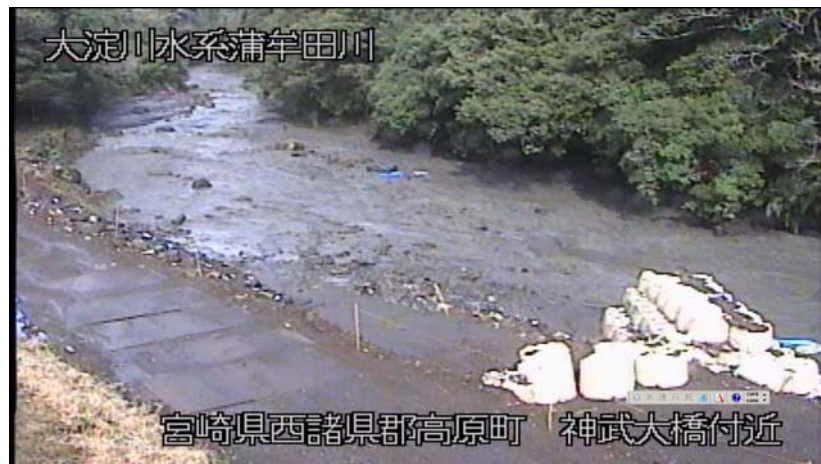
③ 神武大橋付近 平成30年3月5日 9:45現在