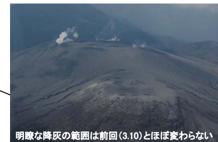
明瞭な降灰の範囲は前回(3.10)とほぼ変わらない 火口周辺斜面の降灰状況 (3月14日)