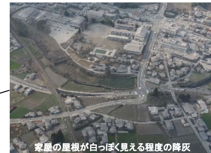
家屋の屋根が白っぽく見える程度の降灰 高原町市街地の降灰状況 (3月14日)