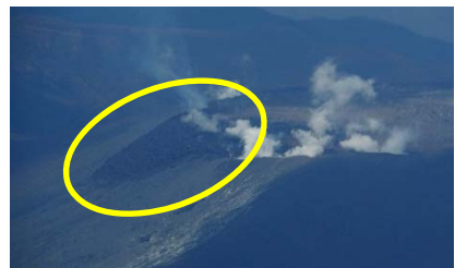
火口縁を乗り越えた溶岩の移動状況(上:3月10日12時頃、下:3月14日14時30分頃)