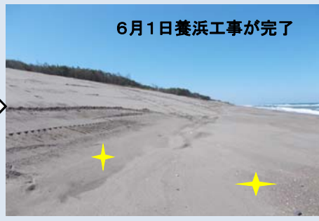
6月1日養浜工事が完了