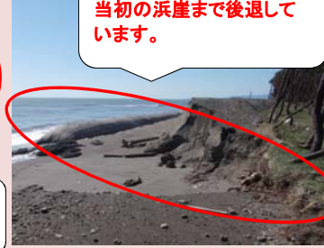
養浜はほぼ流出しましたが、サンドバックにより浜崖は守られています。