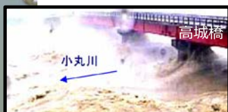
H17.9台風14号通過時の小丸川