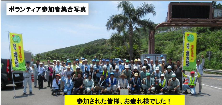
参加された皆様、お疲れ様でした！