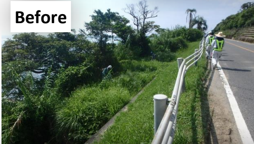
暖竹が繁殖しているため海は見えません！