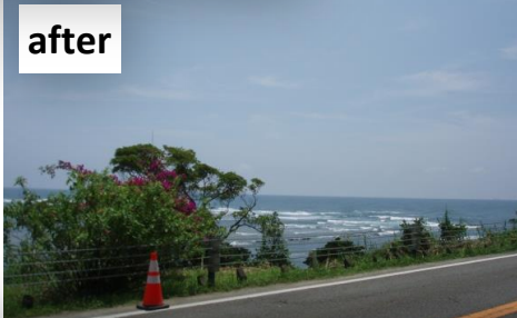
道路から海が見えるようになりました！