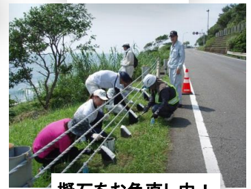
擬石をお色直し中！