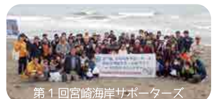
第1回宮崎海岸サポーターズ