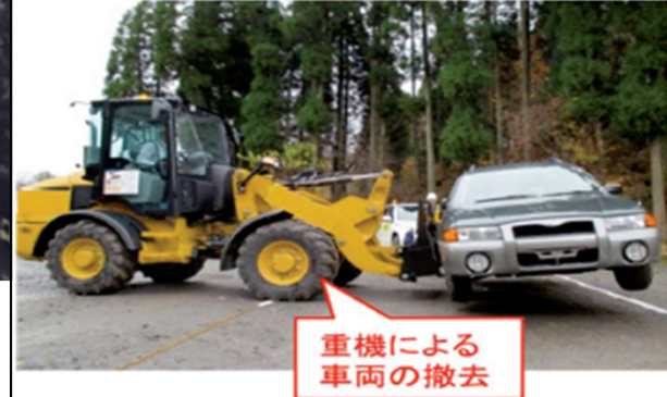
重機による 車両の撤去