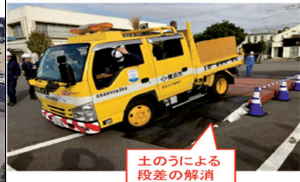
土のうによる 段差の解消