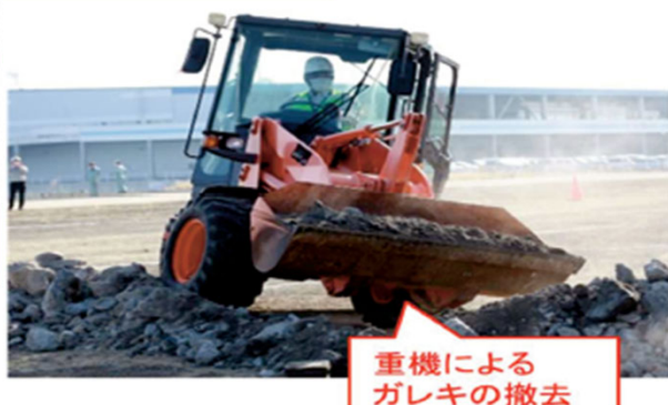
重機による ガレキの撤去