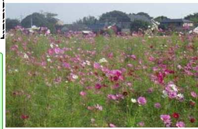
H29.10.11大炊田交差点付近にて撮影