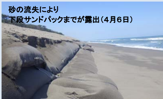
砂の流失により 下段サンドバックまでが露出(4月6日)