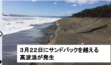
3月22日にサンドバックを越える高波浪が発生