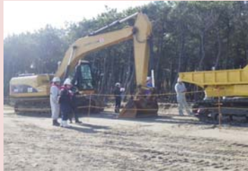
工事現場を参加者各自の目でチェック

最後に宮崎労働基準監督署と宮崎北警察署の講師の方より講話があり、よりいっそうの安全に対する意識を高めました。