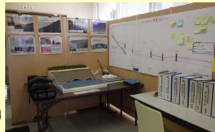
写真や資料等、随時更新しています！