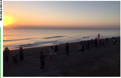
H30.1.1動物園東地区(住吉海岸)にて撮影