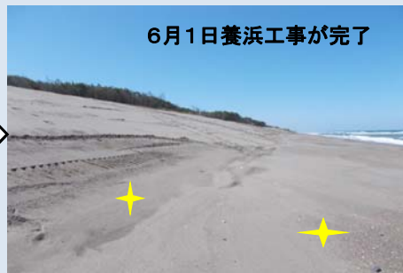
6月1日養浜工事が完了