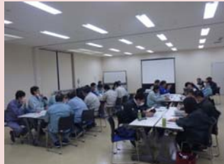
各自感じたことを意見交換