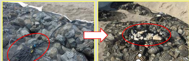
▲大きな石の袋 結束ロープ