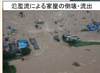
氾濫流による家屋の倒壊・流出