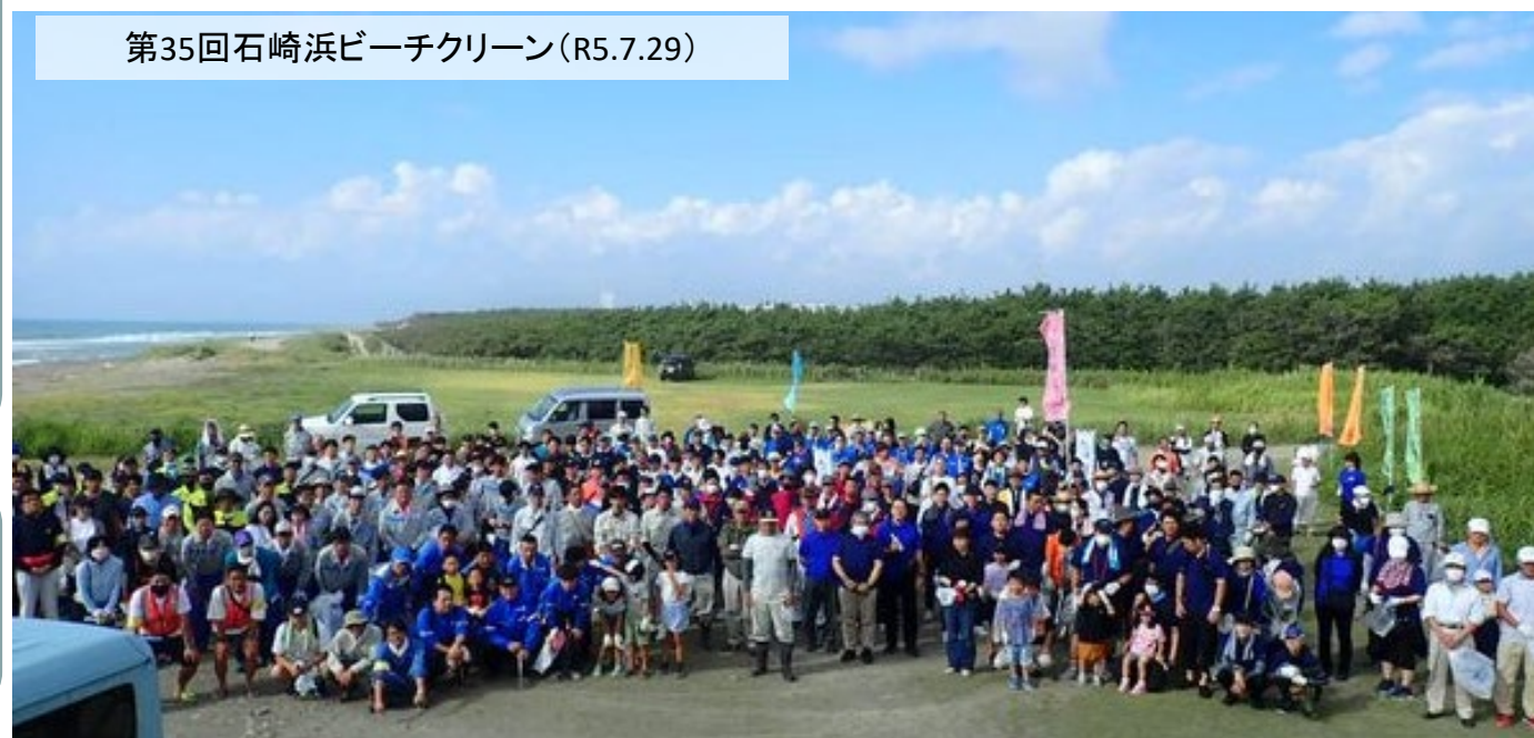
第35回石崎浜ビーチクリーン(R5.7.29)