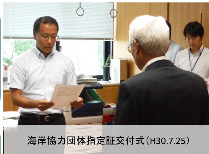
海岸協力団体指定証交付式(H30.7.25)

今後も海岸愛護・美化に関する活動を通じて、 社会に貢献できる団体となることを目指します。