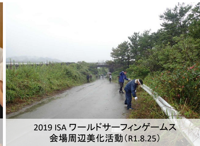
2019 ISA ワールドサーフィンゲームス 会場周辺美化活動(R1.8.25)