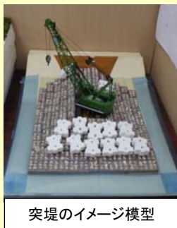
突堤のイメージ模型

みなさまにお気軽にお越し頂けるよう、土足のまま閲覧スペースを楽しんで頂けるようになりました。昔の海岸のお話、宮崎海岸に関するご質問や今の状況が気になる方など、いつでも遠慮なくお越しください♪