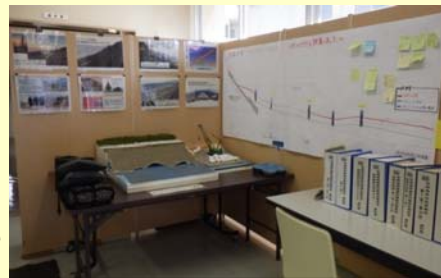
写真や資料等、随時更新しています！