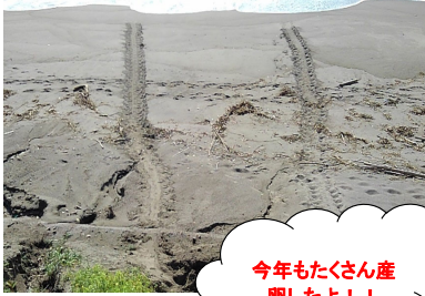
アカウミガメの足跡

宮崎海岸には毎年、5月から8月にかけてアカウミガメが産卵するために上陸してきます。産卵状況の調査を実施している宮崎野生動物研究所の調査によると、今年は例年に比べ、上陸・産卵回数ともに増加しているようです。