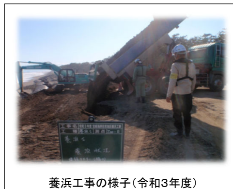
養浜工事の様子(令和3年度)

工事名：令和4年度宮崎海岸養浜（その2）工事 施工期間：令和4年8月11日～令和5年2月28日 施工業者：吉原建設（株）