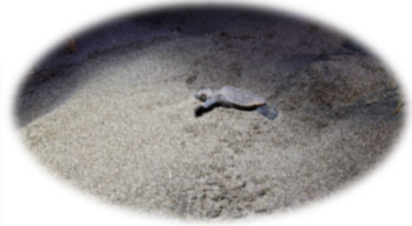
子ガメが海に帰っていく様子