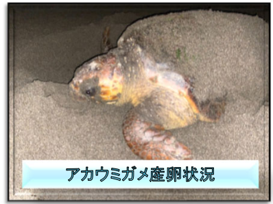
アカウミガメ産卵状況

令和4年10月1日 第80号 国土交通省 宮崎河川国道事務所 宮崎海岸出張所発行