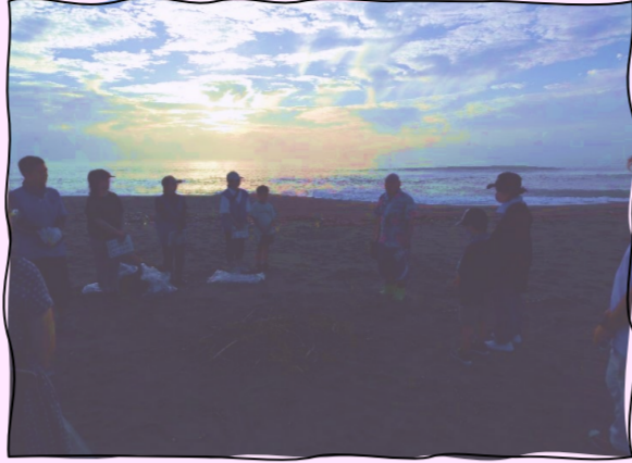
アカウミガメの説明