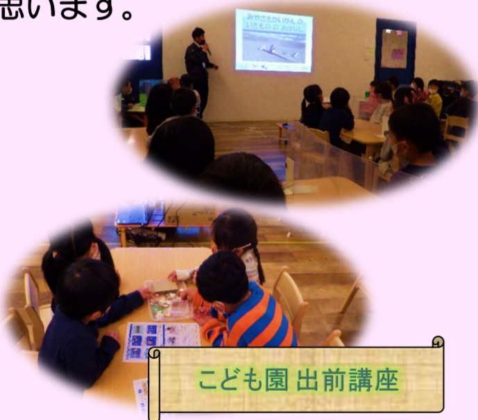
こども園 出前講座

また、実際に宮崎海岸に足を運び、その場で現地を確認しながら事業説明を行うこともしています。宮崎海岸で課題となっている侵食対策についてこういった事業をしているのか、どのような工夫をもたらしているのかなど、現地では分からないことも多いため現地見学は学びの場として良い経験になるかと思ひます。