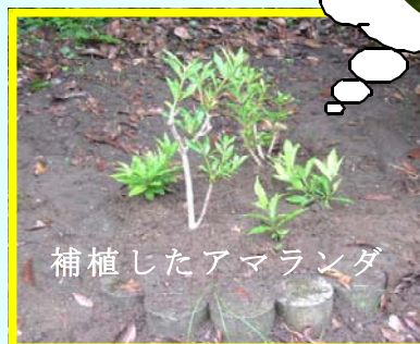
補植したアマランダ