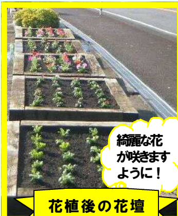
綺麗な花が咲きますように！