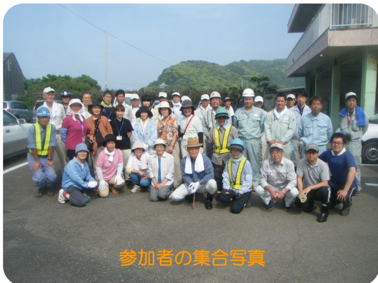
参加者の集合写真