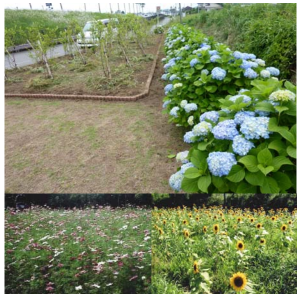
過去には、コスモスや向日葵を植えたことも（写真下左右）。写真上は現在の様子。

「皆と集まり話すことが楽しい。」 「作業の後、とても達成感がある。」 「自分達で最初からつくり上げたものだから、思い入れがあり、愛着がある。」 そんなところに続ける秘訣があるようだ。