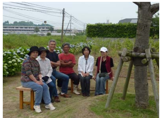
今回お話を伺った「島山花いっぱい地域づくりの会」の皆さん。サトザクラの下は作業のあとの語らいスペースになる。活動の際は、会の皆さんの呼び掛けで、婦人会、島山自治会、自主防災隊、子供会、高齢者などたくさんの人が集まる。