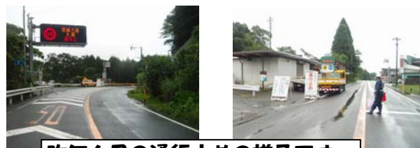
昨年6月の通行止めの様子です。

国道10号四家地区では連続雨量が200mmに達した場合宮崎市高岡町内山～都城市高城町本八重(1.5km)は落石、土砂崩れ等の恐れがあるため通行止めとなります。