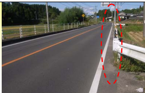
歩道が片側にしかありませんでした。

宮崎県内では、死傷事故の29%が国道で発生し、うち61%が国道10号、220号で起こっています。このような危険な箇所を地域の方と一緒に「事故危険区間」として選定し、道路利用者にも交通事故が起こりやすい危険な箇所との認識を持って頂きながら、集中的・重点的に悲惨な交通事故を撲滅するため、「事故ゼロプラン」として推進しています