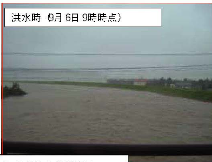
深年川 左岸1/400地点 国富町太田原地区