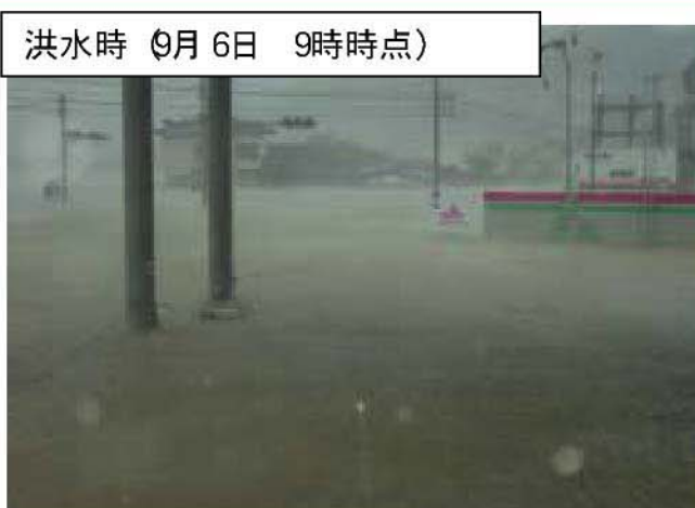
大淀川 右岸18/000地点 高岡町麓地先