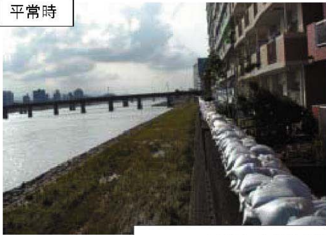
大淀川 左岸2/800地点 宮崎市高洲地先