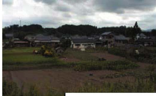
大淀川 右岸15/800地点 高岡町富吉地先