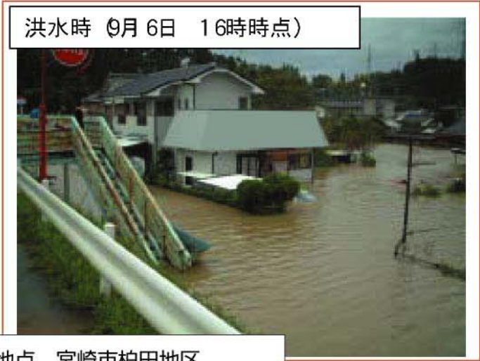
大淀川 左岸10/500地点 宮崎市柏田地区