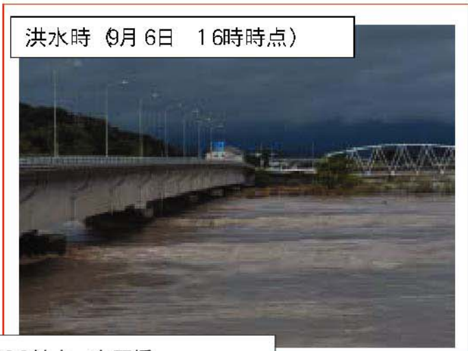
大淀川 右岸13/200地点 有田橋