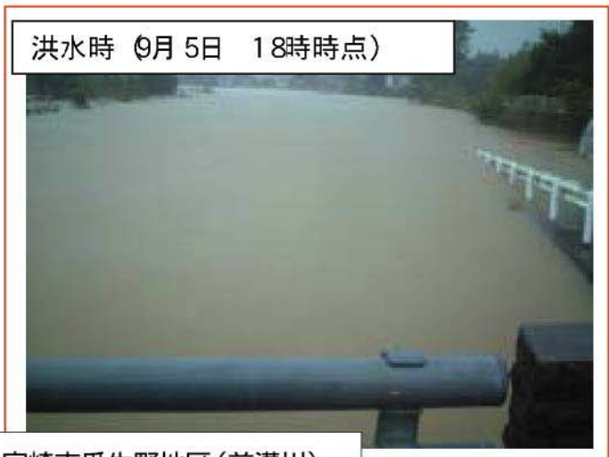
大淀川 左岸11/500地点 宮崎市瓜生野地区(前溝川)