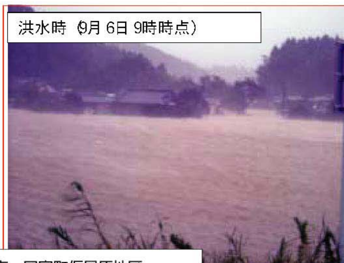
深年川 左岸4/200地点 国富町仮屋原地区