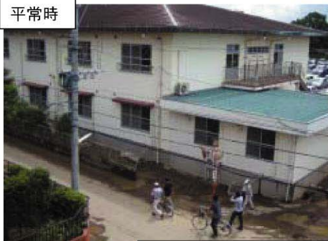
大淀川 右岸8/000地点 宮崎市下小松地区