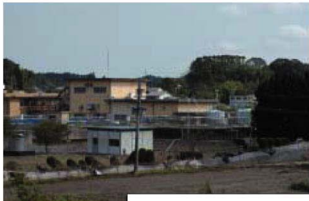
大淀川 右岸15/400地点 大淀川水道局富吉浄水場