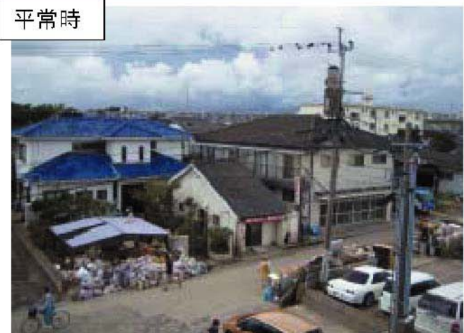
大淀川 右岸8/000地点 宮崎市下小松地区