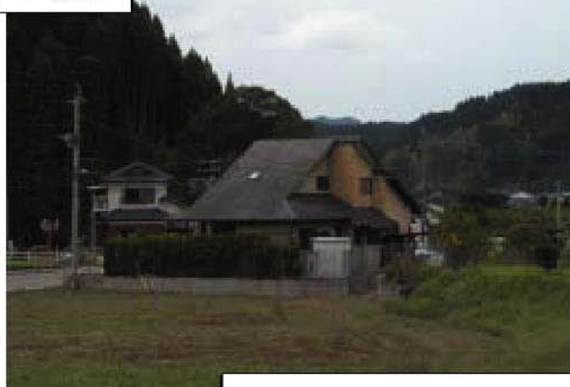
大淀川 右岸18/000地点 高岡町麓地先 穆佐駐在所