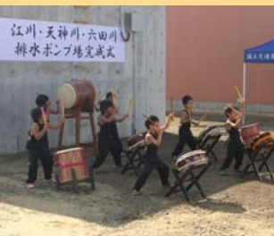
園児による太鼓演奏