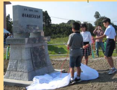
小学生による記念碑除幕