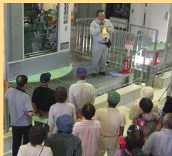
建物内の見学の様子