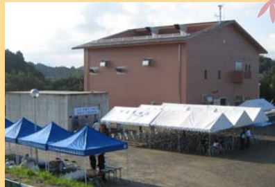
完成式会場 天神川排水機場