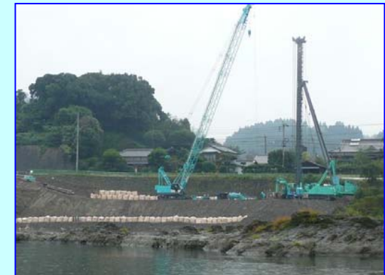
コンクリート製の堤防の基礎となる大型機械による杭施工状況です。