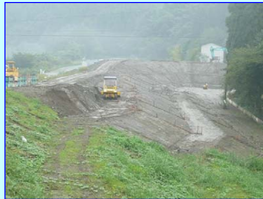
下の谷川地区の築堤工事の施工状況です。