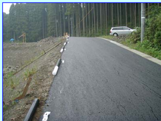
新しく作った堤防の上を乗り越す、上の谷川地区の新しい市道です。