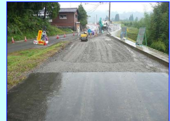
川原田地区と赤谷地区を結ぶ堤防兼歩道が間もなく開通します。工事は高岡土木が発注。