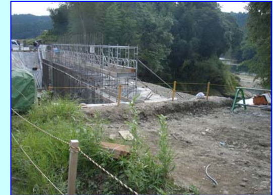
大淀川からの外水を防ぐため、コンクリート製の堤防を作っています。