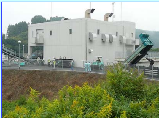
10月30日の完成見学会に向けて場内の舗装状況