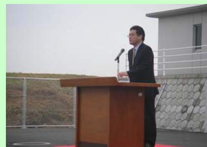
宮崎河川国道事務所長挨拶