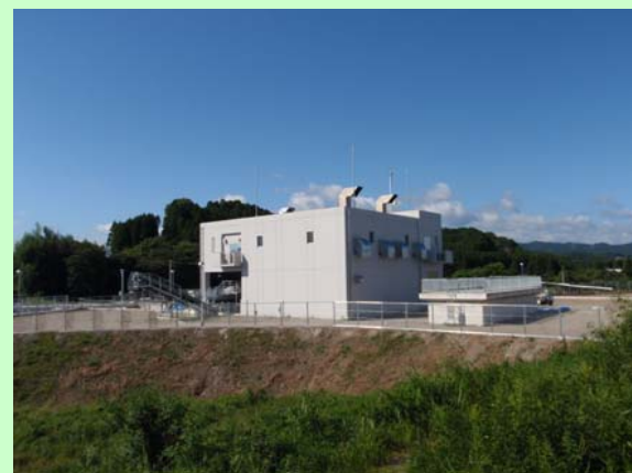
瓜田川排水機場全景