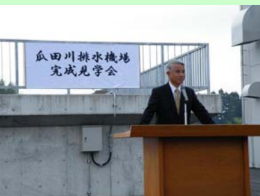
宮崎市高岡地区担当副市長挨拶