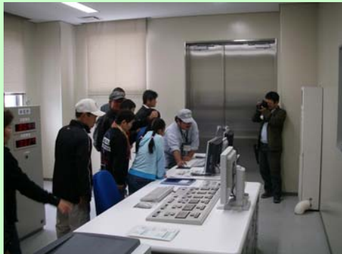
この中央操作室でポンプやその他の機器を操作します。