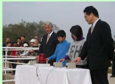
ボタンを押して通水しました。