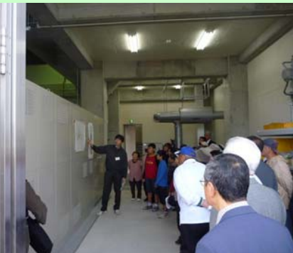
排水機場内部の説明