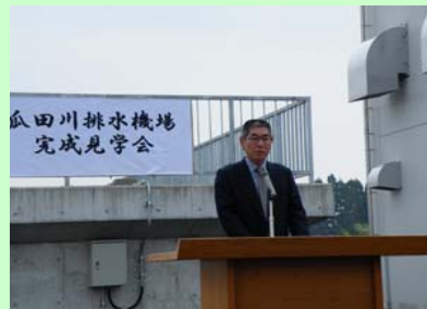
麓地区自治公民館長挨拶