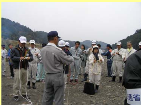
宮崎市北消防署員によるロープワークの指導を受けました。

雨量や河川情報はNHK地上デジタル放送や宮崎河川国道事務所のホームページでも知ることができます。