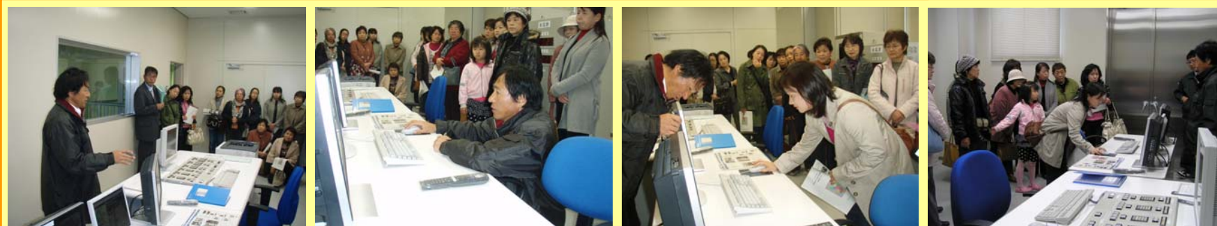
2階の中央操作室でポンプやその他の機器を操作します。