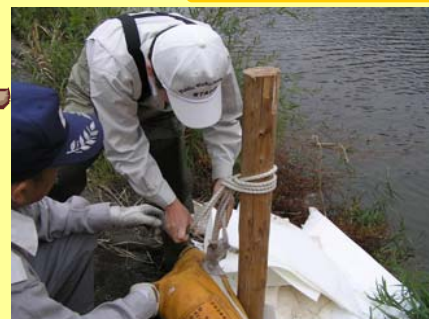
①ロープでしっかり固定します。