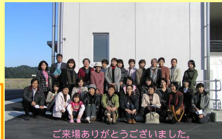
ご来場ありがとうございました。

研修の一環で、10月に完成した瓜田川排水機場の屋内設備を見学しました。皆さん職員の説明を熱心に聞かれていました。防災への意識を高めていきましょう。