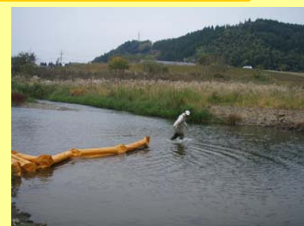
②オイルフェンスを設置します。