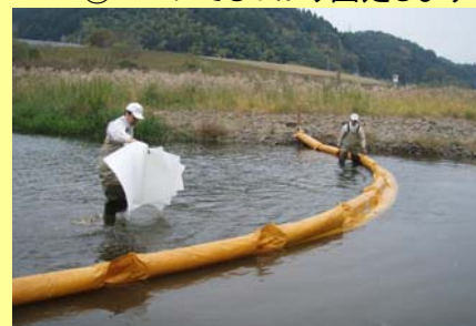
③オイル吸着マットを敷設します。