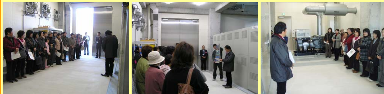
1階の排水機場内部の説明