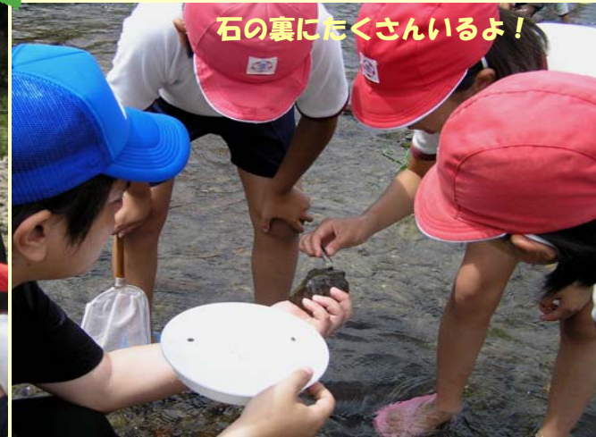
石の裏にたくさんいるよ！