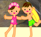
休憩時間は水遊びで楽しみました！