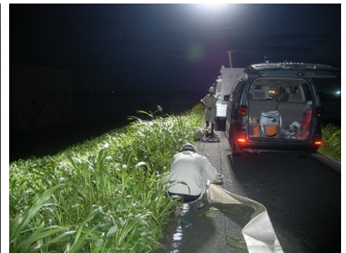
昼夜問わず、作業を行い、排水作業を行いました。