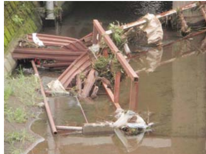
こんなに大きなゴミが!! (全長5m以上の鉄柵)