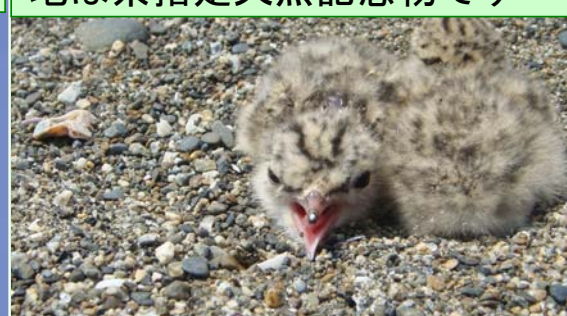
コアジサシは、砂浜や河原で産卵・子育てをします