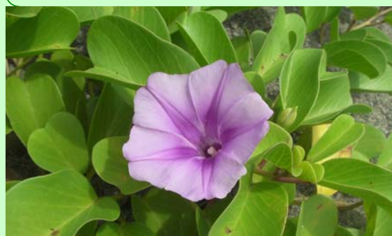
ゲンバイヒルガオ 宮崎県レッドリスト：絶滅危惧 I B類

一方で、ゴミの不法投棄や、砂浜への車の乗り入れなどが環境におよぼす影響を指摘されています。