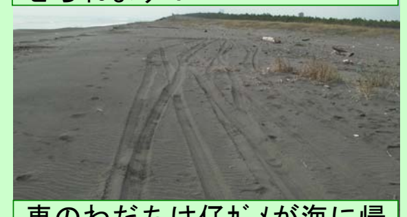
車のわだちは仔ガメが海に帰る時やコアジサシの産卵・子育てに影響を及ぼします！