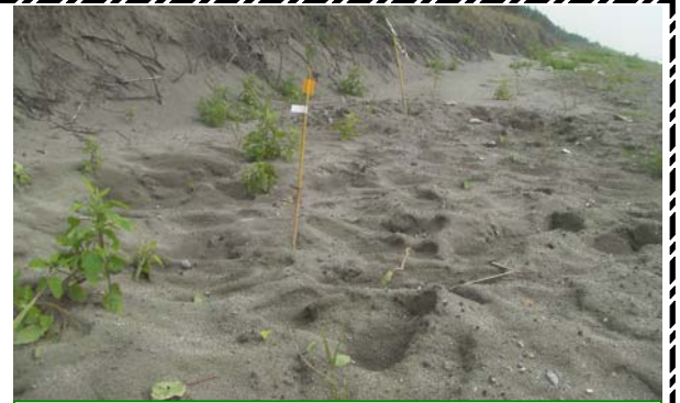
今年も養浜実施箇所でアカウミガメが産卵しています！

平成23年6月21日 第25号 国土交通省 宮崎河川国道事務所 宮崎海岸出張所発行