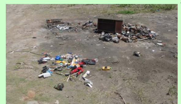
ゴミの投棄は不法行為で罰せられます！