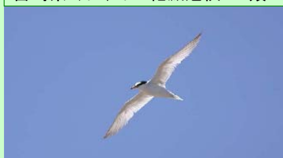
コアジサシ 宮崎県レッドリスト：絶滅危惧 I B類