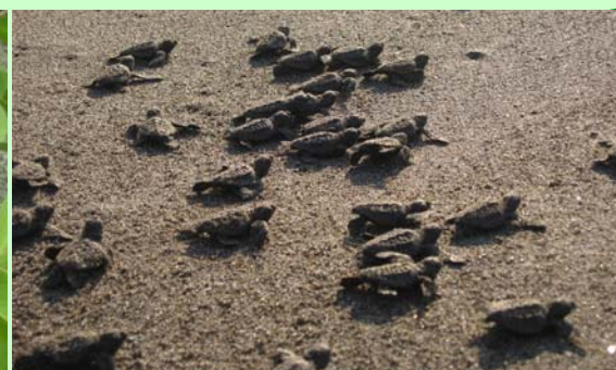
アカウミガメおよびその産卵地は県指定天然記念物です