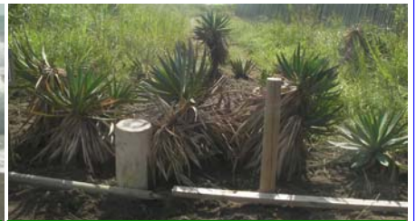
車の乗り入れを防ぐユッカ