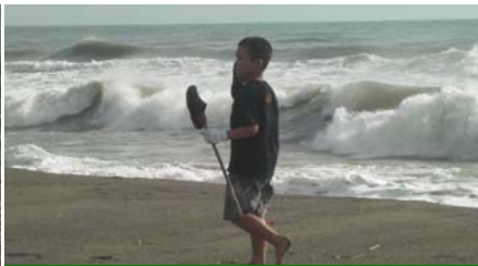
砂浜を裸足で歩くって最高！