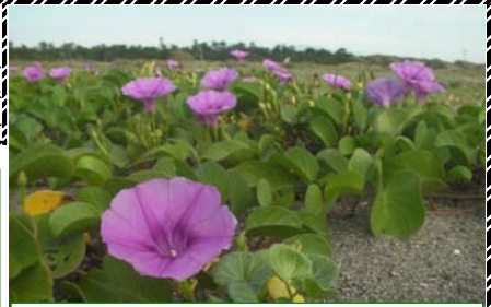
ビーチクリーン活動を見守る