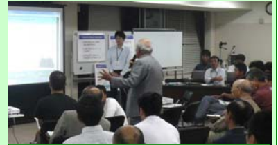
談義所で意見を述べる参加者