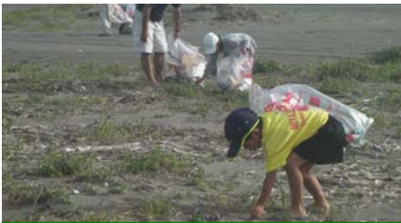
こどもたちも頑張りました！

美しくする会は、海岸に関心をもってもらうには「多くの人びとに海岸に目を向けてもらうことが重要」との認識から、今後もこのような活動を実施します。