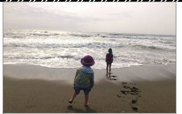
子供達のために美しい海岸を

平成24年5月21日 第34号 国土交通省 宮崎河川国道事務所 宮崎海岸出張所発行