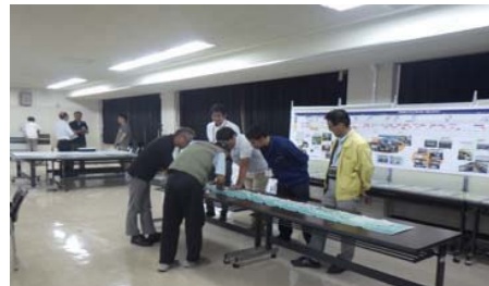
会議前に「何でも質問コーナー」を開設しています