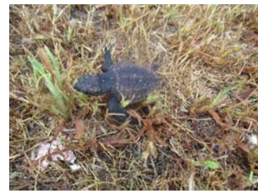
昨年のビーチクリーンでも見る事ができました

運良く見つけることができた場合は、進む道を邪魔しないようにそっと見守りましょう。