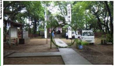
夏越しの大祓 茅の輪くぐり