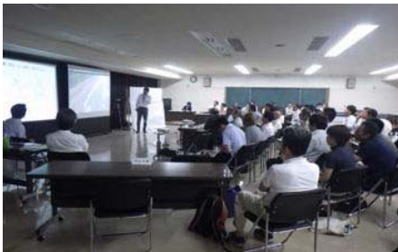
談義所の市民参加者は19名でした

※会議の開催前30分程度で、初参加の方と以前から参加の方との知識のギャップを埋め、市民談義所への理解を深めてもらうため、来場者を対象とした相談窓口として「何でも質問コーナー」を開設しています。