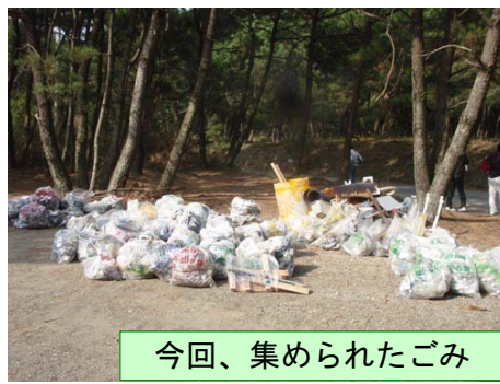
今回、集められたごみ