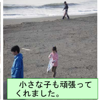
小さな子も頑張ってくれました。