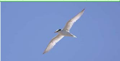
コアジサシ 環境省レッドリスト：絶滅危惧Ⅱ類