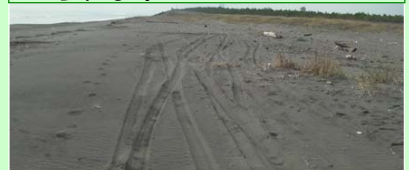
車のわだちは仔ガメが海に帰る時やコアジサシの産卵・子育てに影響を及ぼします！