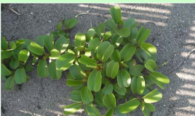
ゲンバイヒルガオ 宮崎県レッドリスト：絶滅危惧ⅠB類

一方で、ゴミの不法投棄や、砂浜への車の乗り入れなどが環境におよぼす影響を指摘されています。