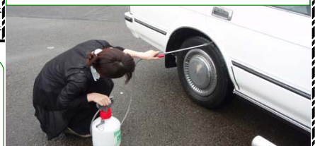
当所の消毒作業の様子