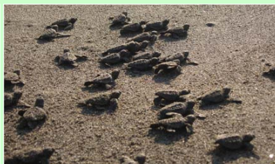
アカウミガメおよびその産卵地は県指定天然記念物です