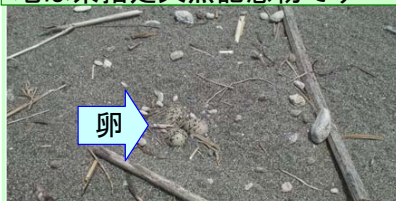
コアジサシは、砂浜や河原で産卵・子育てをします